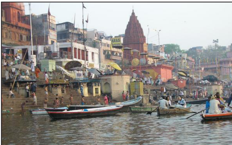
Рекиите во Индија

Посебно природно богатство на Индија се пространите низини во кои се наоѓаат околу 50% плодно и обработливо земјиште во Индија. Особено е важна Хиндустанската Низина (меѓу Хималаите и висорамнината Декан), која е пространа рамница испресечена со реки и пловни канали, добро проодна, мошне плодна и стопански најразвиена област на Индија. Слична е и Бенгалската Низина која ги зафаќа териториите околу делтата на реките Ганг и Брамапутра. Овие низини се главни земјоделски области и главен извор на храна за многубројното индиско население. Се одгледуваат култури што успеваат во умерените, тропските и суптропските појаси. Најмногу се произведуваат ориз, пченица, пченка, компир, зеленчук, маслодајна репка, коноп, памук, лен и др.