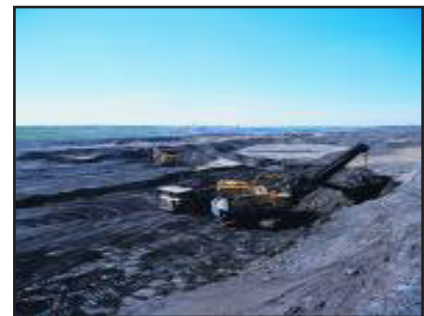
Ископ за јаглен